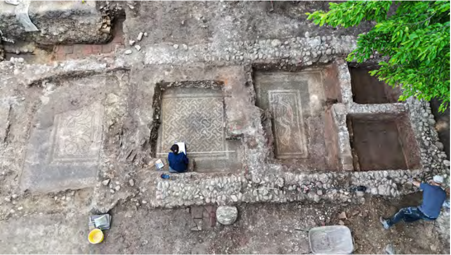
Villa in Thalheim bei Wels (Foto: Oberösterreichische Landes-Kultur GmbH).

Die bisher durch die Georadar-Messungen sowie Ausgrabungen erfassten Ruinen erstrecken sich auf eine Fläche von etwa 1.000 Quadratmetern. Bei den Ausgrabungen 2024 und 2025 wurden insgesamt sechs Wasserbecken freigelegt, drei kleinere Becken sind mit Ziegelplatten ausgelegt, die anderen drei mit Mosaiken. Und es gibt Hinweise, dass im angrenzenden Bereich, der noch nicht ausgegraben ist, weitere Becken liegen könnten. Bei dem Vortrag werden die bisherigen Ergebnisse der Ausgrabungen vorgestellt und ein Überblick zum Fundmaterial und damit verbunden der zeitlichen Einordnung des Komplexes gegeben. Ein besonderer Schwerpunkt wird auf die Becken und die Mosaiken gelegt und dabei der Frage nachgegangen, worum es sich hierbei handeln könnte.