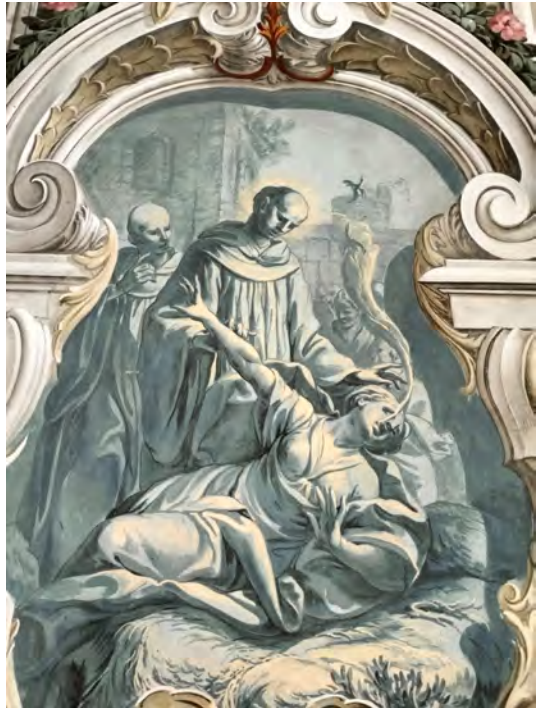
Fresko im barocken Festsaal des Stiftes Sams zur Erinnerung an die im Kloster Sams seit dem Spätmittelalter durchgeführten erfolgreichen Exorzismen, Raumgestaltung durch Baumeister Georg Anton Gumpp zw. 1719 und 1729.

Zugleich traten auch erste Skeptiker und Kritiker auf, die jedoch kaum Gehör fanden. In der Zeit der Aufklärung, besonders ab der Regentschaft Kaiser Josefs II., gerieten die Anhänger und Anhängerinnen des Teufels- und Dämonenglaubens zunehmend in die Defensive. Dennoch hielt die katholische Kirche an der realen Existenz „gefallener Engel“ und „böser Geister“ fest. Die betreffenden Glaubenssätze sind auch aktuell noch in Kraft, ebenso das kirchliche Exorzismus-Ritual von 1614, das Papst Johannes Paul II. 1999 in einer leicht ‚modernisierten‘ Fassung neu veröffentlichen ließ.