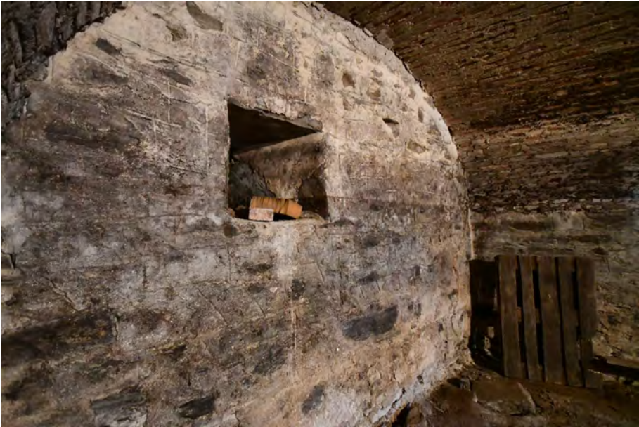
Der Salzburger Hof in Oberarnsdorf.

stand erhalten sind. Ihre Erforschung bietet wertvolle Einblicke in vormoderne Formen von Eigentum, Arbeitsteilung und Mobilität.