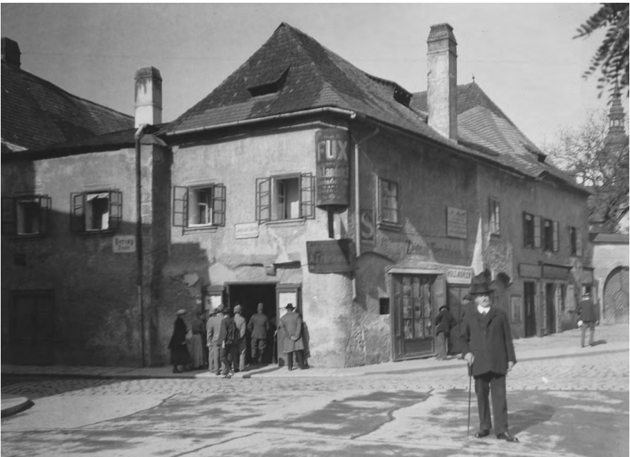
Der Salzburger Hof in Krems in den 1920er Jahren.

Bis heute lassen sich etwa 130 solcher Lesehöfe in der Wachau und angrenzenden Gebieten nachweisen, wenngleich nicht alle in ihrem baulichen Be-